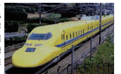
東海道新幹線掛川付近走行中の923形T4編成

営業運転に使うN700S新幹線車両に状態管理システムを搭載して、電車線設備の画像を解析して設備の異常を検知する機能、画像および点群データから軌道材料の状態を詳細に把握できる軌道材料モニタリング機能なども搭載。営業車両で「ドクターイエロー」と同等以上の