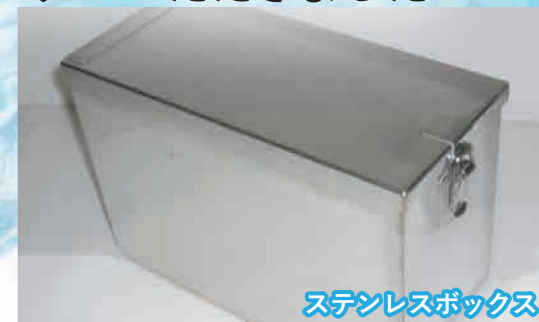
ステンレスボックス