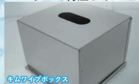
キムワイプボックス