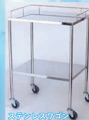
ステンレスワゴン

サイズ(縦・横・高さ)オーダーできます 飲食店や美容関係、その他水廻りや清潔を求める場所に最適です